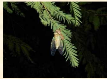
セミの羽化と夜の虫観察会