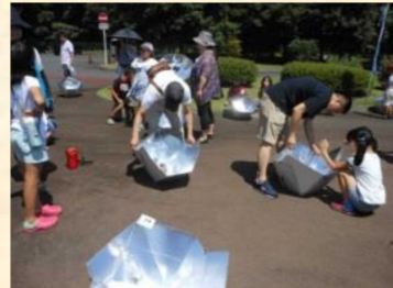
ソーラークッカーで料理

親子対象の自然観察会や工作、大人の方対象の環境学習や不用品材料を利用した作品作り、バス見学会や講演会、など各種プログラムを実施しています。