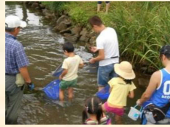
川で遊ぼう調べよう